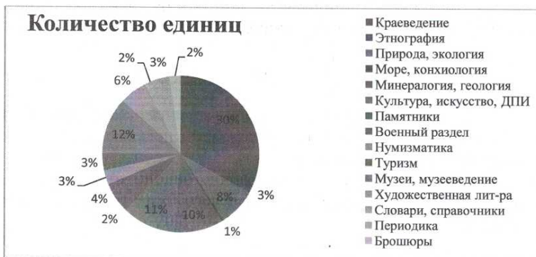
Таблица № 9. Диаграмма по библиотечному фонду.

Большую часть библиотечного фонда составляют книги следующей тематики (Таблица № 9): «Краеведение»-30 %, «Музеи, музееведение» – 12 %, «Культура, искусство, ДПИ» – 11 %, «Минералогия, геология» – 10 %.